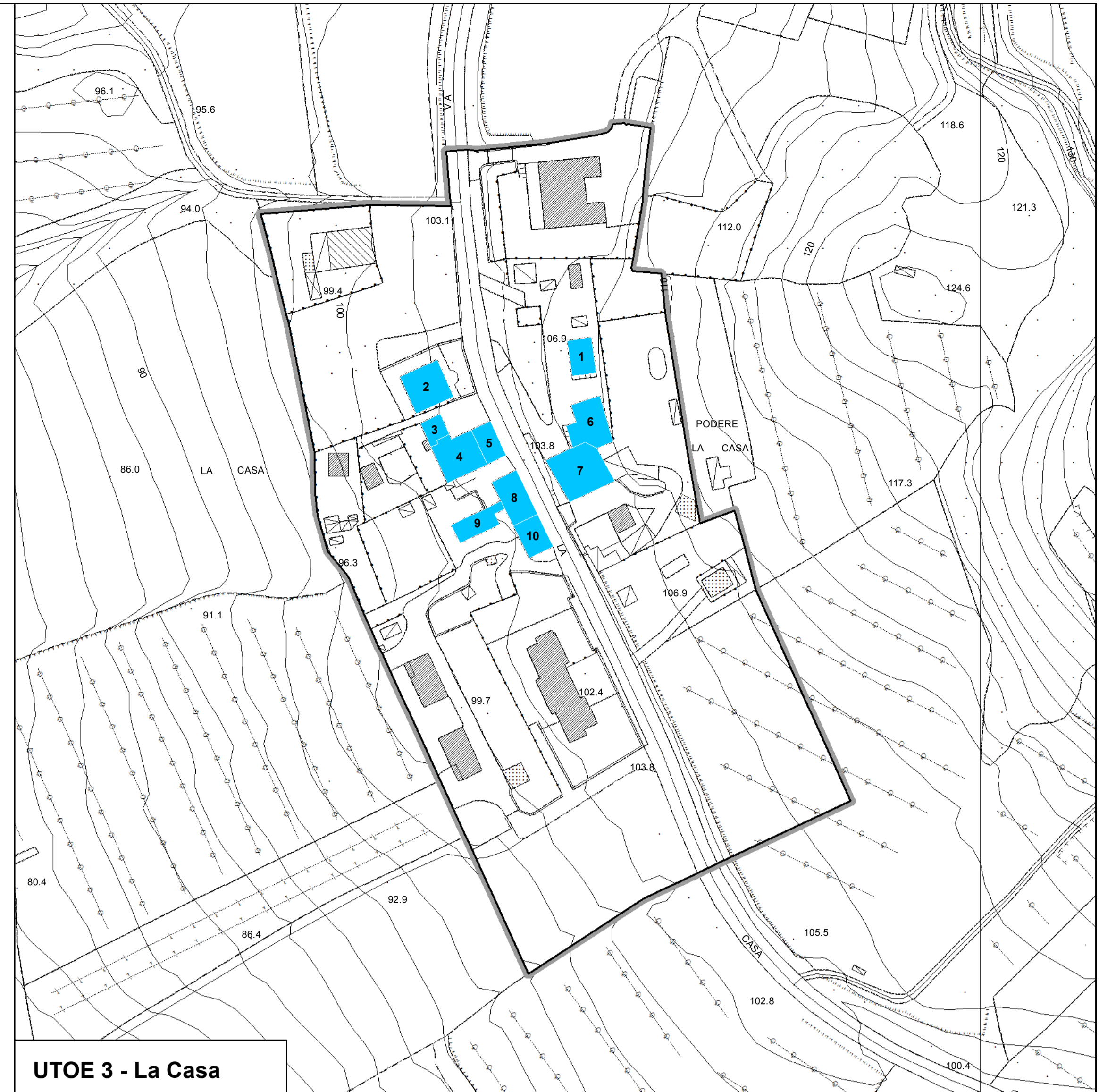
UTOE 3 - La Casa