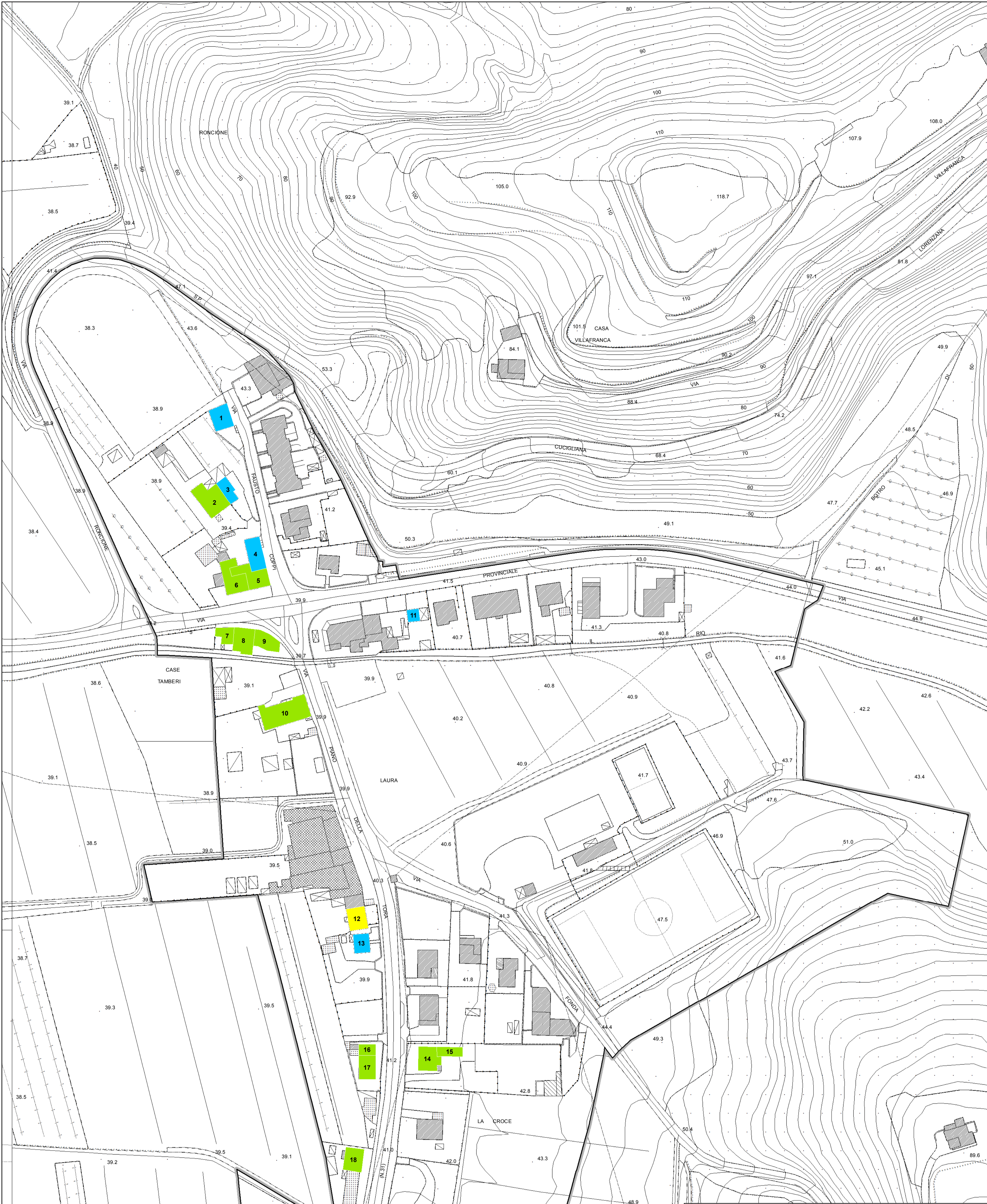
UTOE 1 - Laura